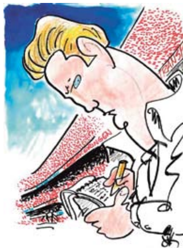
■ Louis van Gaal.

“Tja”, verzucht de oude meester met een knipoog, “dat had iets met de liefde van doen... Ik ontmoette destijds in Twente mijn huidige partner. Zij werd door haar oude werkgever, het