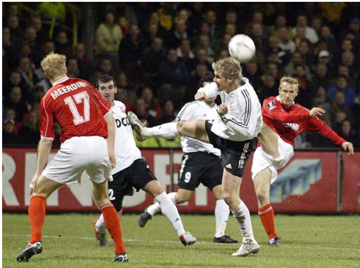
De 2-0 tegen Shaktar Donetsk in het historische Adriaanse-seizoen. “Misschien wel mijn mooiste ooit. Ik raakte ‘m héél lekker...”